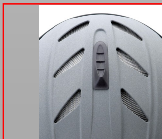
Aération sur casque FLY