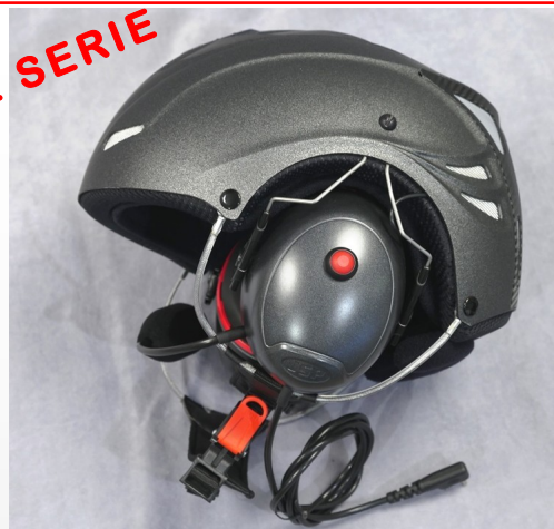
FLY PARAMOTEUR PREMIUM S3