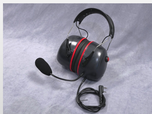
SERRE-TETE PARAMOTEUR PREMIUM S3